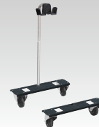
Guruló talp 037717